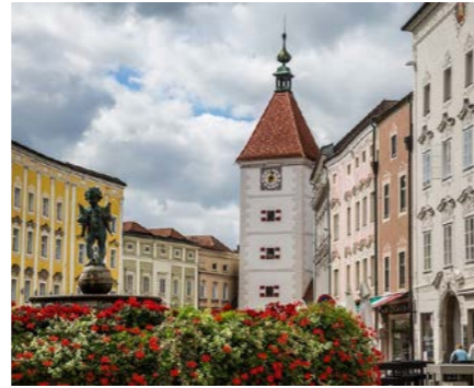
Stadtplatz Wels 18,4 km / 20 Min. Auto