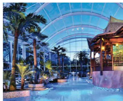
Eurothermenresort Bad Schallerbach 30,7 km / 25 Min. Auto