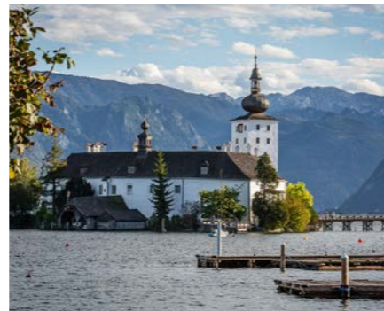
Stadtplatz Gmunden 29,2 km / 26 Min. Auto