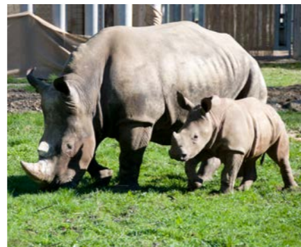
Zoo Schmiding 24,2 km / 21 Min. Auto