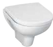
Wand-Tiefspül-WC Laufen Pro * weiß mit Drückerplatte Geberit