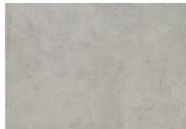
Feinsteinzeug in moderner Beton- und Cottoptik