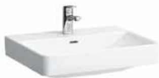
Waschtisch Laufen Pro weiß mit Armatur Hansa Flex *

Eine Dusche ist nicht im Leistungsumfang enthalten.