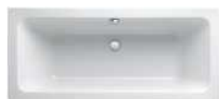
Badewanne Keramag, weiß * Symbolbild