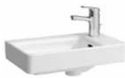
Handwaschbecken Laufen Pro weiß mit Armatur Hansa Flex *